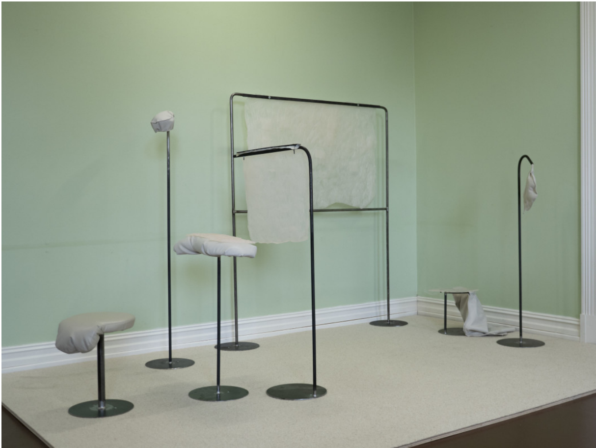
"Flexible Schedule" av Maren Dagny Juell på Atelier Nord.